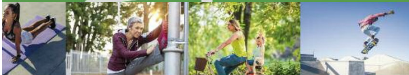
Illustration et photos non contractuelles

permettra de développer l'attractivité des lieux et de se réapproprié ce site unique. Poumon vert au bord de l'eau, le Parc se vaudra intergénérationnel et éclectique puisque chacun pourra pratiquer une activité sportive, s'aérer, se retrouver autour d'un pique-nique, réaliser ses photos de mariage, se rafraîchir.